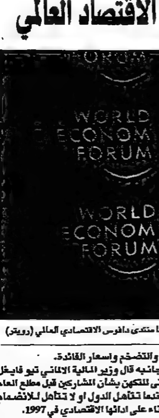
منظر من الاجتماع وسط مدينة دافوس للمنتدى الاقتصادي العالمي

دافوس - دبي: حذر رئيسا شركتي مايكروسوفت وانتل الأمريكيتين من ان أوروبا تواجه خطر التخلف عن تكنولوجيا الحاسبات الالية (الكمبيوتر).